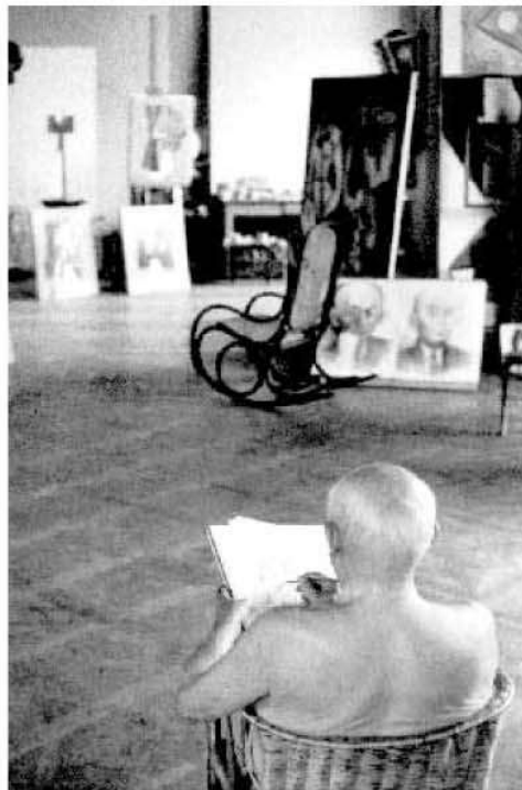
BOHEMIA. Pablo Picasso, fotografiado en su estudio.

Los cinco caballos blancos aluden a los cinco espectros del único poema que escribió Casagemas, admirador del poeta simbolista Maeterlinck, y a los cinco comensales que estaban presentes el día del suicidio en un restaurante, L'Hippodrome de París, según la