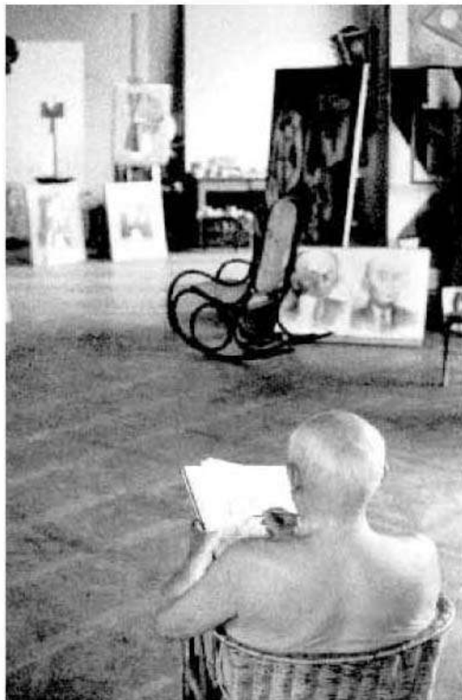
BOHEMIA. Pablo Picasso, fotografiado en su estudio.

Los cinco caballos blancos aluden a los cinco espectros del único poema que escribió Casagemas, admirador del poeta simbolista Maeterlinck, y a los cinco comensales que estaban presentes el día del suicidio en un restaurante, L'Hippodrome de París, según la